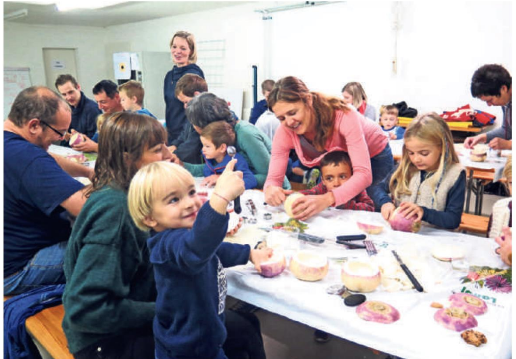
Mit dem passenden Schnitzwerkzeug hantieren: Was für ein Spass für die Buben und Mädchen!

RIED | Dank der US-Sitcom «The Big Bang Theory» kennen sie möglicherweise Fernsehzuschauer weltweit, die Schweizer Tradition des Räbeliechtliumzugs. Am Wochenende hätten sich die Serienhelden rund um Besserwisser Sheldon Cooper live in Ried ein Bild vom stimmungsvollen Herbstbrauch machen können, welcher vermutlich ins 19. Jahrhundert zurückreicht. Bevor der Umzug jedoch stattfinden konnte, stand die nicht weniger vergnügliche «Arbeit» an: Am Samstagmorgen gestalteten die Kinder hübsche Räbeliechtli, die sie am Sonntag mit viel Stolz im Dorf präsentierten. Organisiert hatte den Anlass der Elternverein ABGRU.